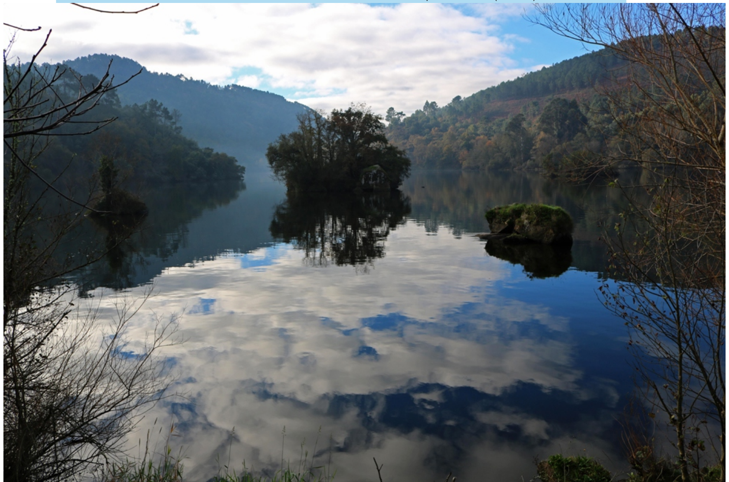
Confluencia do Arnoia co Miño.