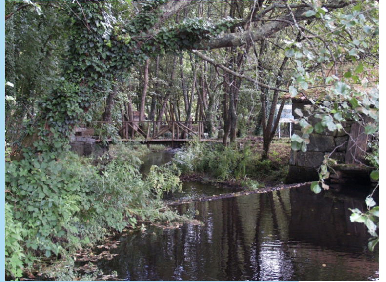
Área de lecer do Inquiavou no Pomar (A Arnoia).