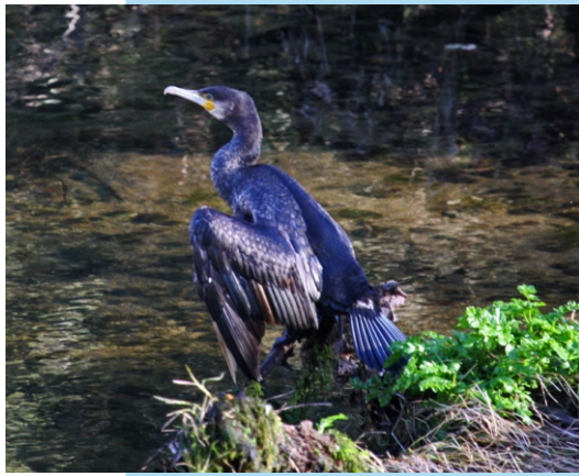
Corvo mariño real