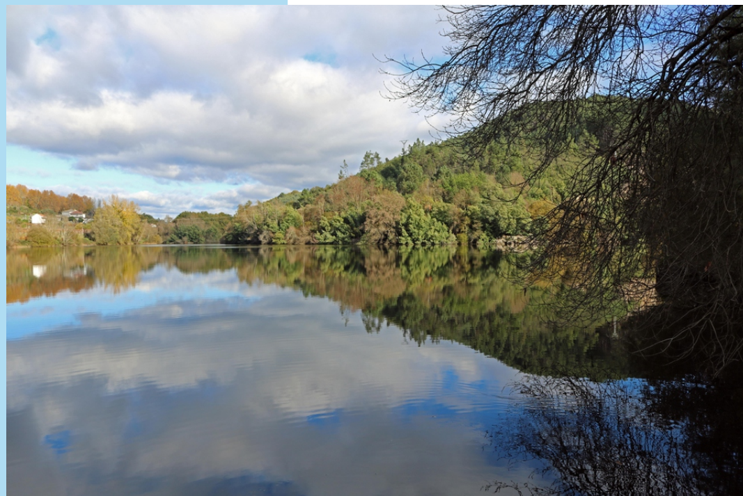
Confluencia do Avia co Miño.

Ao ser un percorrido lineal podemos aforrar a viaxe de volta buscando un medio de transporte que nos leve a calquera dos puntos de inicio.