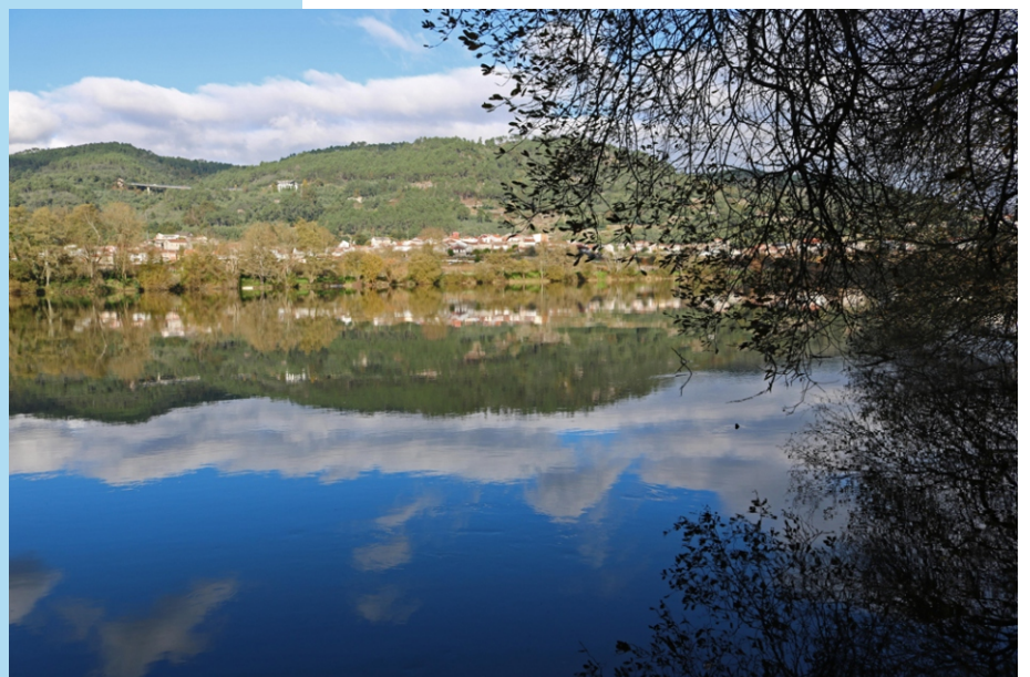
Vista do río Miño cara a Francelos (Ribadavia).