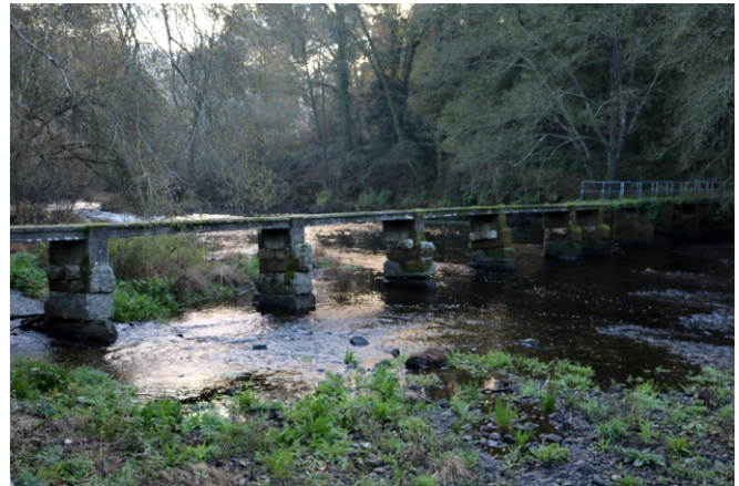
Área de lecer das Poldras en Outeiro Cruz (A Arnoia).