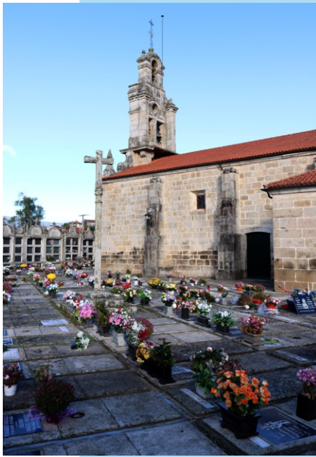
Igrexa de San Salvador en Outeiro Cruz (A Arnoia)