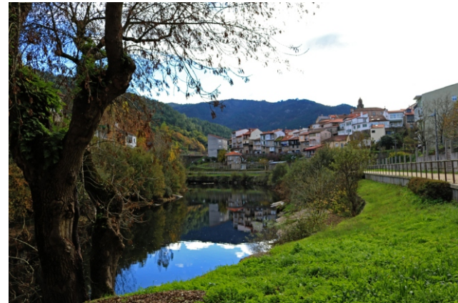
O Avia en Ribadavia.